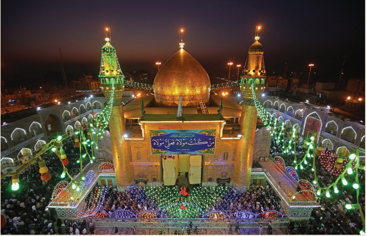
من احتفالات عيد الغدير الأغرّ في العتبة العلوية المقدسة