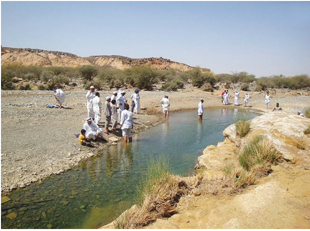
مجموعة من الموالين ينهلون من غدير الولاية

يستفاد من مراجعة التاريخ أن يوم الثامن عشر من شهر ذي الحجة الحرام كان معروفاً بين المسلمين بيوم «عيد الغدير»، وكانت هذه التسمية تحظى بشهرة كبيرة إلى درجة أن ابن خلكان، الذي تحدّث عن مبايعة الخليفة العباسي المستعلي