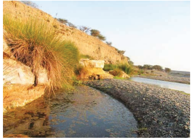
يقع «غدير خُم» على مفترق طرق الحجاج إلى اليمن والشام والعراق...

ثم لم يتفرقوا حتى نزل الوحي بقوله تعالى: ﴿..الْيَوْمَ أَكْمَلْتُ لَكُمْ دِينَكُمْ وَأَتَمَمْتُ عَلَيْكُمْ نِعْمَتِي وَرَضِيتُ لَكُمُ الْإِسْلَامَ دِينًا..﴾ المائدة: ٣.