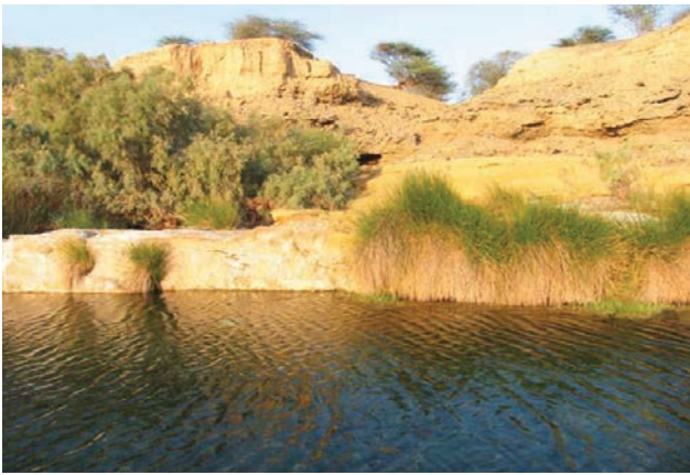
«غدير خُم» حيث بايع الصحابة والمسلمون أمير المؤمنين ﷺ خليفة للنبي ﷺ

الخميس، الثامن عشر من ذي الحجة، نزل عليه الوحي في آية الإبلåg بقوله: ﴿يَأْتِيهَا الرُّسُولُ بَلِّغْ مَا أُنزِلَ إِلَيْكَ مِنْ رَبِّكَ وَإِنْ لَمْ تَفْعَلْ فَمَا بَلَّغْتَ رِسَالَتَهُ وَاللَّهُ يَعْصِمُكَ مِنَ النَّاسِ..﴾ (المائدة: ٦٧). وأمر الله تعالى النبي صلى الله عليه وآله وسلم، أن يقيم علياً عليه السلام معلماً للناس، ويبلغهم ما نزل فيه من الولاية وفرض الطاعة على المسلمين. وكان أوائل القوم قرييين من الجحفة، فأمر رسول الله صلى الله عليه وآله وسلم أن يرّد من تقدّم منهم، ويحبس من تأخّر عنهم في ذلك المكان.