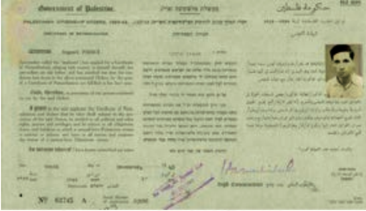
الوثيقة الأولى: بيريز يطلب الجنسية الفلسطينية

للحصول على الجنسية. وخصت معظم هذه الطلبات يهوداً قدموا إلى فلسطين من دول أوروبا الشرقية وشغلوا فيما بعد مناصب هامة في الكيان الصهيوني التي تم الإعلان عنها كدولة في العام ١٩٤٨. طلب التجنيس الذي تقدم به شمعون بيريز، وعليه توقيعاً بخط يده، قد تم العثور عليه من شركة إسرائيلية تعمل في مجال دراسة السلالات وتحصلت على هذه الوثائق السرية والرسمية من هيئة الأرشيف الإسرائيلية.